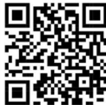
ตัวอักษรแบบกระทรวงศึกษาธิการ

ชั้น ป.๔ - ๖ ใช้ปากกาปากกาสีดำ ขนาด ๐.๕ มม. ตัวบรรจงครึ่งบรรทัด ความยาว ๑๕ - ๒๐ บรรทัด หรือไม่เกิน ๑ หน้ากระดาษ A๔